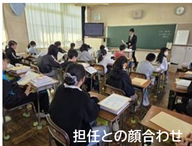
担任との顔合わせ