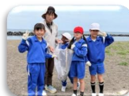
試走の時は、海岸清掃も行いました！

5月22日（金）に鷹巣小中学校伝統の砂浜マラソンを実施しました。小雨決行となりましたが、子どもたちは精いっぱい砂浜を駆け抜けることができました。当日は保護者の皆さんの温かい声援が、子どもたちの大きな励みになったようです。帰校後は、雨の中で疲れたけれど頑張ったと嬉しそうに話す子がたくさんいました。ご支援ありがとうございました。