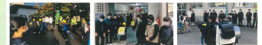
小中合同あいさつ運動