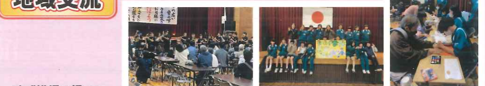
地域講師を招いて