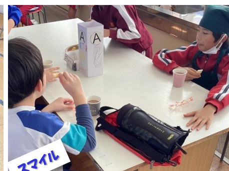
スマイル 12/18 足羽一中校区交流会