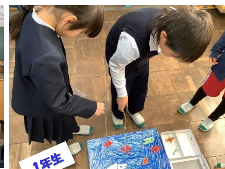
1年生 12/9 秋のおもちゃランド