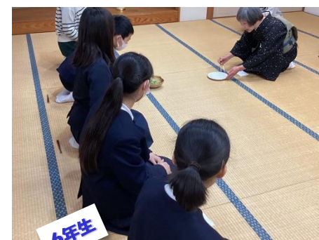
6年生 12/17 茶道体験学習