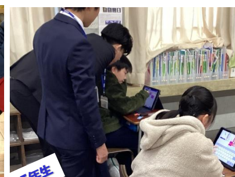
5年生 12/12 プログラミング学習