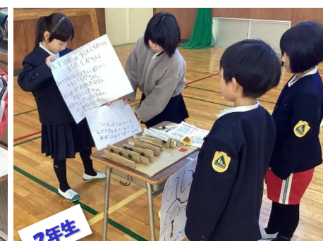
2年生 12/19 うごくおもちゃランド