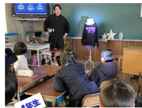
4年生 12/4 反射材 出前授業

健康委員会が企画・進行了た体のつくりや働きを楽しく学べる活動でした。健康委員が、それぞれのコーナーで進行をし、活躍していました。