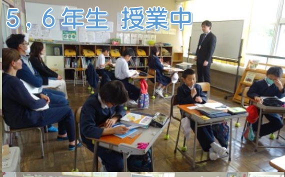
5, 6年生 授業中