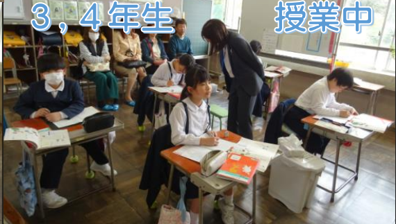
3, 4年生 授業中