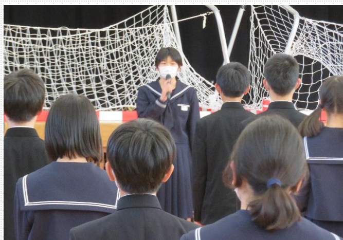
【生徒会長あいさつ】

5月10日に生徒総会がありました。今回は執行部が提案した「課題提出率向上計画」について、意見や改善案を話し合いました。今後「解決方法の決定」→「決めたことの実践」→「振り返り」→「次の課題解決へ」活動することを期待します。