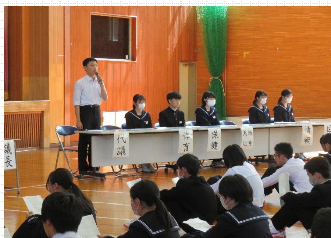
【専門委員長による活動予定の報告】