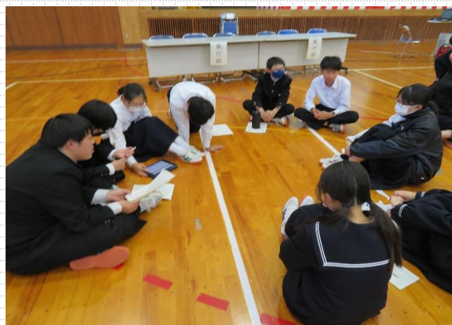
【異学年での話合い】