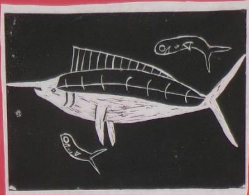
3年 1組 ***サメが泳ぐ***