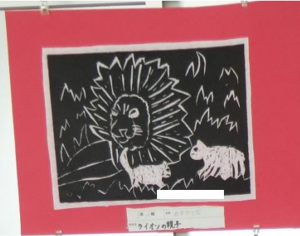
3月1日 〇〇〇〇〇〇〇〇 ライオンの顔