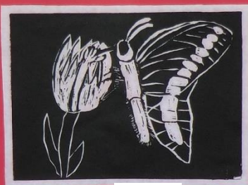
3年 1組 ***チューリップのバタフライ***