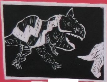
3年 1組 ***カサネの恐竜***