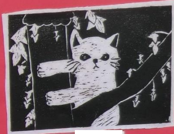
3年 1組 ***木の枝に猫***