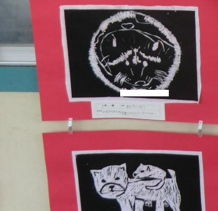
3月1日 〇〇〇〇〇〇 〇〇〇〇〇〇〇〇〇〇〇