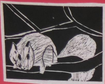
3年 1組 ***カリスのたね***