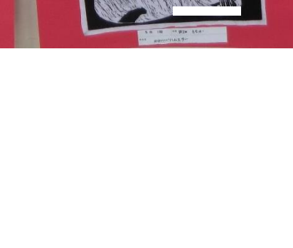
3月1日 〇〇〇〇〇 〇〇〇〇〇〇〇〇〇〇