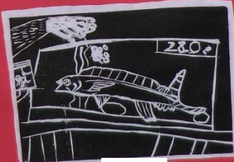
3年 1組 ***すいすいの魚***