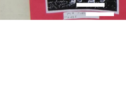
3月1日 〇〇〇〇〇 〇〇〇〇〇〇〇〇〇〇