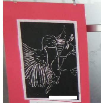
3月1日 〇〇〇〇〇〇 〇〇〇〇〇〇〇〇〇〇