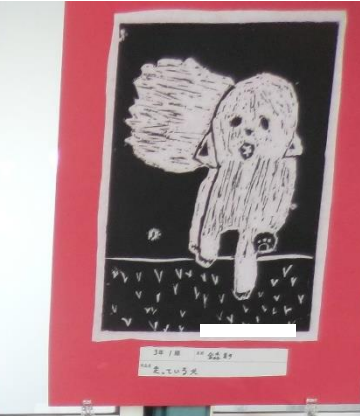
3月1日 〇〇〇〇〇〇 〇〇〇〇〇〇〇〇〇