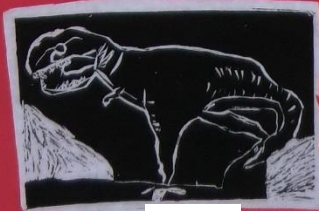
3年 1組 ***カサネの恐竜***