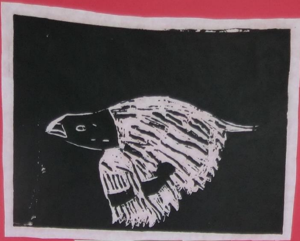
3年1組 名前: [redacted] 作品名 空おとんごる。