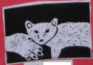
3年 1組 ***カサネの猫***