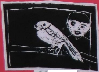
3年 1組 ***カサネの鳥***