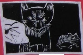
3年 1組 ***カサネの猫***