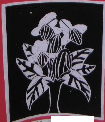
3年1組 [redacted] 作品名 色紙の家スミの花