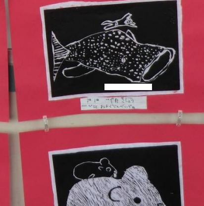
3月1日 〇〇〇〇〇〇 〇〇〇〇〇〇〇〇〇〇