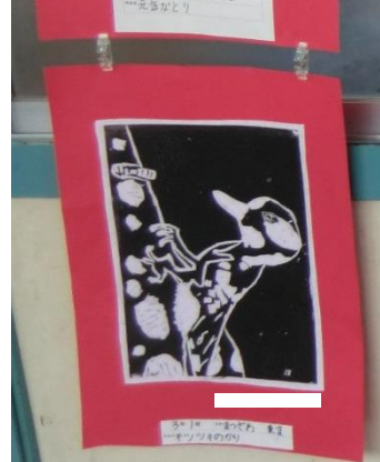
3月1日 〇〇〇〇〇〇 〇〇〇〇〇〇〇〇〇〇