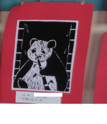
3月1日 〇〇〇〇〇〇 〇〇〇〇〇〇〇〇〇〇