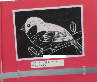
3月1日 〇〇〇〇〇〇 〇〇〇〇〇〇〇〇〇