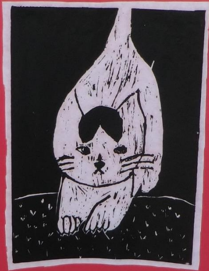
3年1組 [redacted] 作品名 雙子座を走るねこ