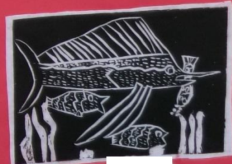
3年 1組 ***カサネの魚***