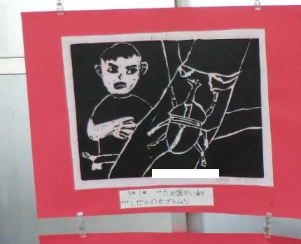
3月1日 〇〇たけのこ 〇〇〇〇〇〇〇〇〇〇〇