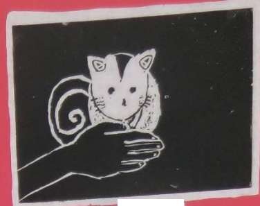
3年 1組 ***手にのびる猫***