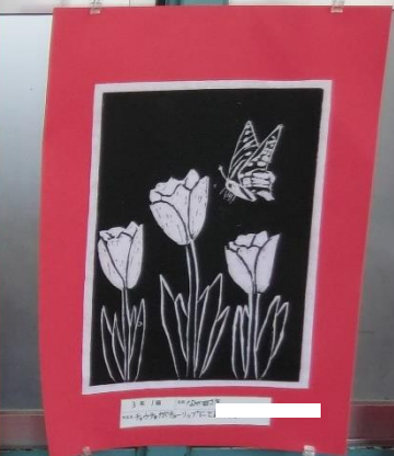
3月1日 〇〇〇〇〇〇 〇〇〇〇〇〇〇〇〇〇〇