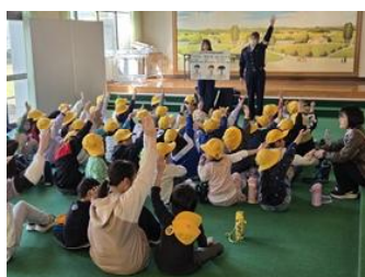
安全な歩行について（1年生）

4月23日の全校下校指導では、福井ユナイテッドFCの選手や関係者の方、福井南署の署員の方にご来校いただき、子どもたちに「いかのおすし」など安全に過ごすための大切なポイントについてご指導いただきました。今回の学びを生かし、これからも自分の命を守る行動を大切にしたいと思います。