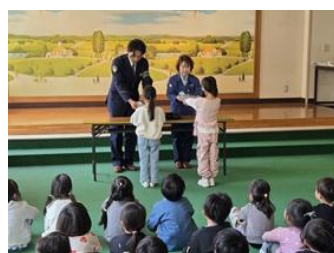
反射材贈呈式（1年生）