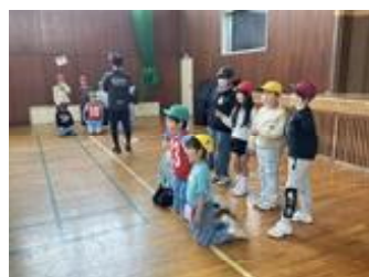
グループ写真撮影