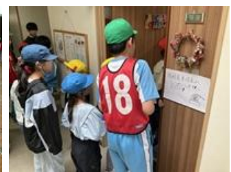
オリエンテーリング