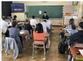
学年・学級懇談会