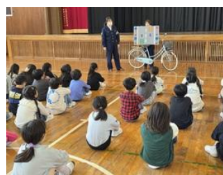
安全な自転車の乗り方（3年生）