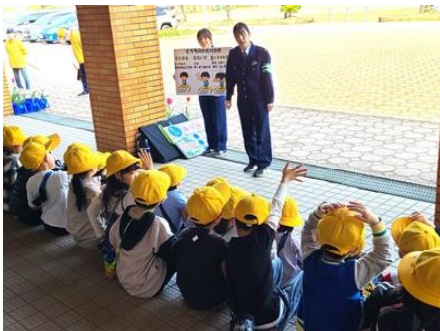
安全な歩行について（1年生）

4月17日（木）、福井南署の署員の方、安全協会の皆さん、PTAあんぜん部、保護者の皆様のご協力を得て、1年生と3年生の交通安全教室を実施しました。1年生は、安全な歩き方について、3年生は、安全な自転車の乗り方について、署員の方のお話をうかがった後、実際に道路を歩いたり、グラウンドで自転車に乗ってみたいりしました。普段は何気なく歩いたり、自転車に乗っていたりする子どもたちですが、いつもより安全に気をつけ緊張感をもって、活動に参加していました。