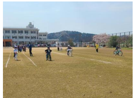
安全な自転車の乗り方（3年生）