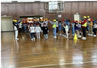
1年生を迎える会 （1年生入場）

4月30日（水）には「1年生を迎える会」を実施しました。1年生を迎える会では、1年生はもちろん全校の子どもたちの笑顔づくりのために、6年生が頑張ってくれました。5月1日の朝礼の後には、各委員会の委員長が、委員会の紹介と協力をお願いをしました。