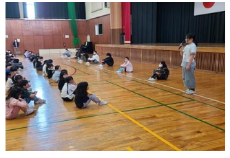
6年委員長による 委員会紹介