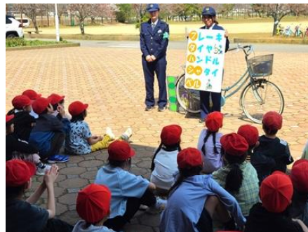
安全な自転車の乗り方（3年生）