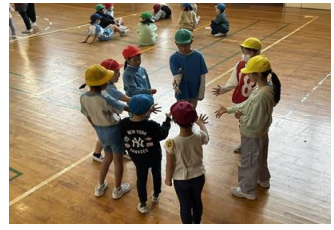
1年生を迎える会 （グループ遊び）