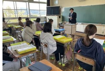
学年・学級懇談会