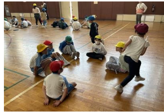
1年生を迎える会 （グループ遊び）