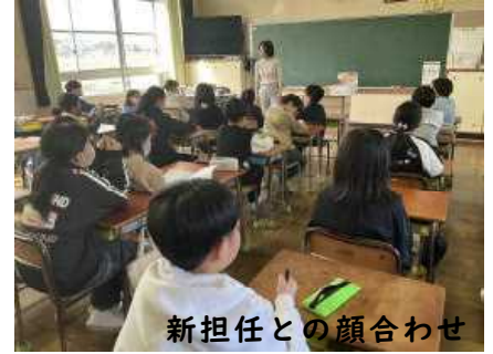
新担任との顔合わせ