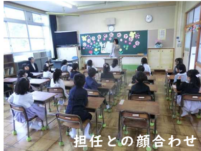
担任との顔合わせ