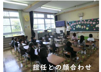
担任との顔合わせ