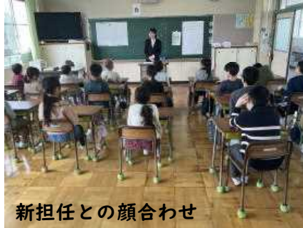
新担任との顔合わせ