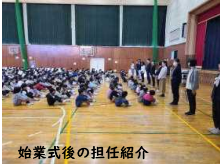
始業式後の担任紹介

春休み明けの初日となる「始業式」でしたが、体育館への入り方、待ち方、とても素晴らしかったです。特に6年生は、いちばん最初に体育館に入り、他の学年の子どもたちのよいお手本となっていました。