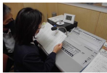
放送室からスピーチ

ぼくが2学期がんばりたいことは、算数です。理由は4年生になり算数がむずかしくなりました。特に文章題が苦手で苦戦することがよくありました。だから2学期は、さらに算数がむずかしくなるので、がんばりたいです。