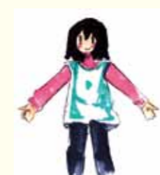
② 服を着るように、首と手を通す。