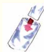
② 長袖の中に余りの布を入れる。