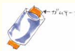
③ 筒を通すようにガムテープを付ける。