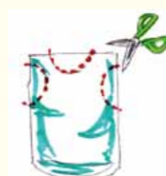
① ゴミ袋に頭、腕用の穴を開ける。