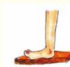
② 足を段ボールに重ね、足の大きさに合わせカットする。 (同じものを3枚用意) × 2