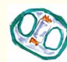
④ 下着の股の部分に合うように貼り付ける。