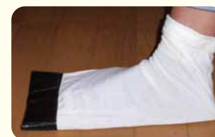
実際に作ってみました!