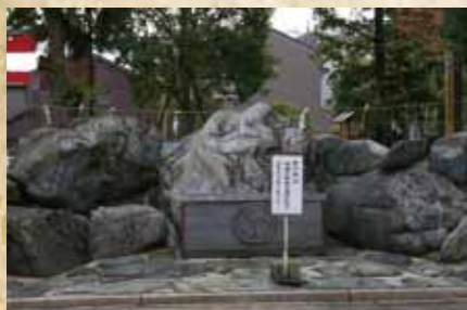
人面岩 人面岩があるよ。見つけてね！