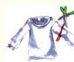
① 袖を袖口から 15cm の長さに切る。