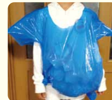
思ったより、暖かいよ!