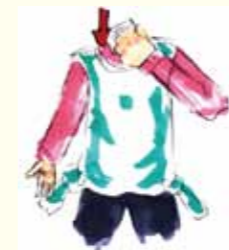
④ 袋の中に、くしゃくしゃにした新聞紙を入れる。