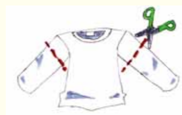
① 上着の長袖を 40cm くらいに切る。