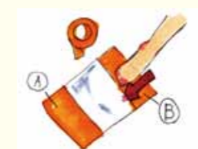
④ 袖の中の段ボールに足を乗せ A、Bをガムテープで留める。