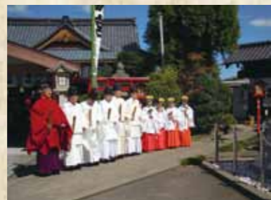
神社祭礼（春・秋） 5月と9月に、お祭りがあるよ！来てね！