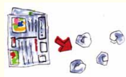
③ 新聞紙をくしゃくしゃにする。