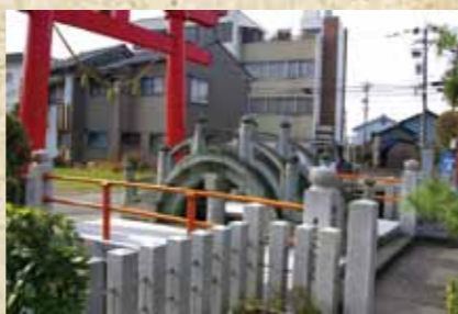
やくよけばし 江戸中期の建立 都市景観重要建築物に指定