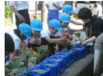
【夏野菜を一人1種類植木鉢で育てる】

2年生は、一年間、植木鉢や学校給食畑、学校園などでいろいろな野菜作りに取り組みました。