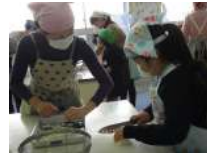
【学校園で大根の種まき・間引き・下葉とり・収穫・おでん作り】

今年度、2年生は多くの野菜作りに取り組みました。自分たちで世話をして育てた野菜を給食に使ったり、調理して食べたりしました。その結果、育てた野菜はもちろん、野菜全般にわたり「好きになった」が17.8%見られました。お家の方のご協力もいただき有難うございました。(栄養教諭 青山)