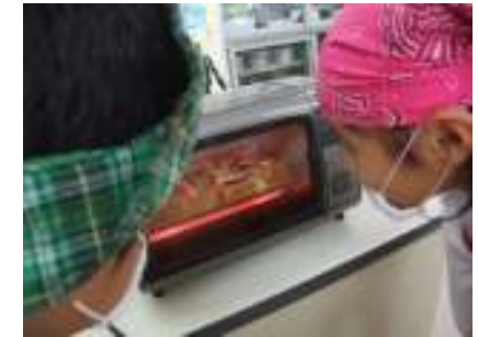
【学校園で育てたトマトでピザトーストづくり】