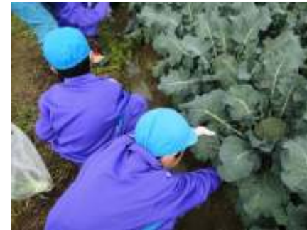
【久喜津町の畑でブロッコリーの苗植え・収穫】