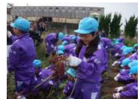
【白方町の畑でさつまいもの苗植え・収穫】