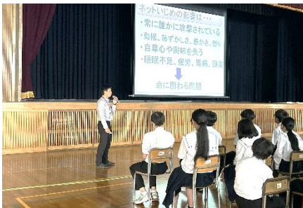
情報モラル講習会

6月からは部活動に関して活動時間が2、3年生と同じになったり、夏季大会が行われたりするなど1年生にとってより慌ただしい時期だったと思います。7月2日、3日には第1回定期テストが行われます。小学校の時以上に勉強や部活動、習い事などに時間を費やし、忙しい日々を過ごすこととなりますが、何事も全力で取り組んでいくことで大きく成長できます。心身の健康を第一に考えながら、成長できるチャンスを逃さずにこれからもチャレンジしていきましょう！