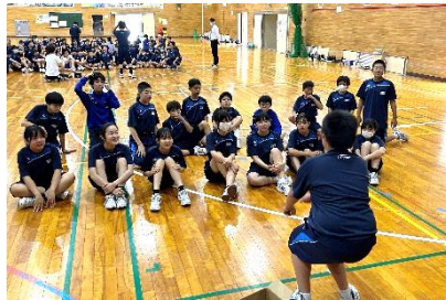
学年レク①(ジェスチャーゲーム)