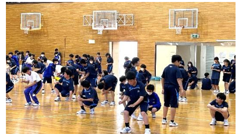
学年レク②(だるまさんの1日)