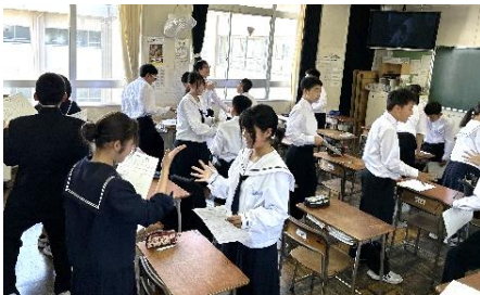
エンカウンター(クラス探偵ゲーム)

6月からは部活動の終了時刻も2、3年生と同じになり、本格的な中学校生活のスタートとなります。心身の負担も今まで以上になると思いますが、自分のペースを掴みつつ、しっかりとした目標をもって、挑戦し続けていきましょう。