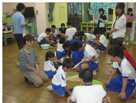
うまくできるかなあ

中学生は幼稚園児に優しく教えながら，幼稚園児は中学生の動きをまねていきながら，お互いが楽しく学び合っていました。そして，シャボン玉ができるとどちらも笑顔いっぱいになっていました。