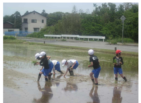
ゆっくり ていねいに

J Aや地元の方の指導を聞きながら、初めての田植えを行いました。泥に足をとられながらも、転ぶことなく、ゆっくりと気をつけながら手で植えていきました。総合的な学習の授業として、田んぼの様子を観察していき、秋の収穫にも参加する予定です。