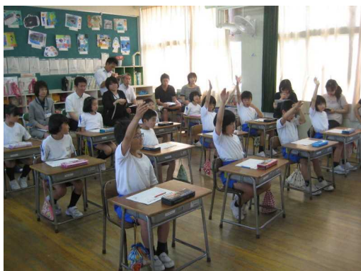
先生 当ててください

6月3日（火）に教育委員会の先生方が学校訪問に来られました。幼稚園と小学校では2年生，4年生から6年生までの授業を参観して頂きました。しっかりと話を聞いたり，じっくりと考えたりする姿，ペアやグループ，全員での話し合いや発表も多く見られて，がんばっている様子をほめて頂きました。