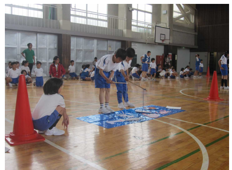
釣れたのはオクトパスかな？

小さいうちから英語に親しむことで、英語に興味関心をもてると考えています。さらに、これからの英語の学習を楽しみになることも期待しています。