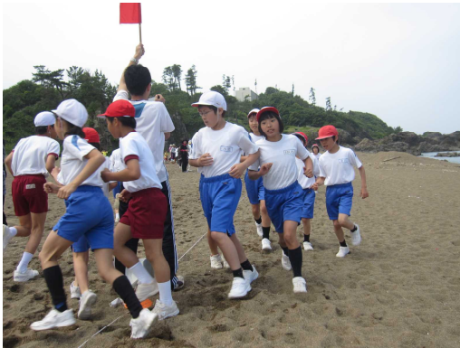
さあ 折り返しだぞ

5月27日(火)に砂浜マラソンが実施されました。前日の雨も上がって、まさにマラソン日和となりました。業間に浜風マラソンで走っている子どもたちはグラウンドと比べて、足をとられる砂浜を走りながら、苦しい表情ながらもがんばっていました。お家の人や地域の方々の温かく、多くの声援も力になっていました。走り終えた表情は、とても晴れやかですてきな笑顔にあふれていました。