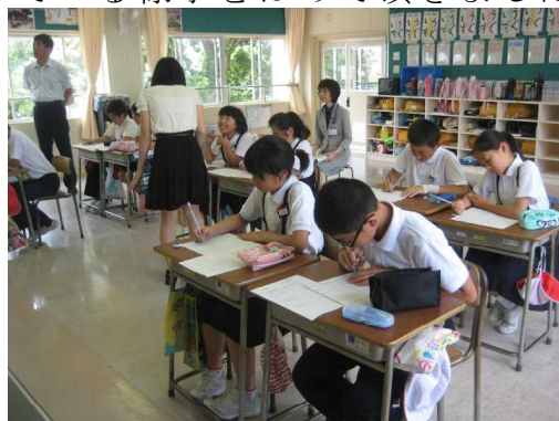
じっくりと考えてよう