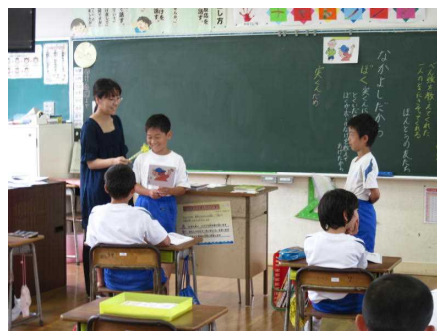
道徳の授業の様子