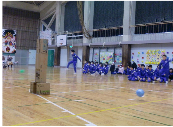
6年生に挑戦 キックオフ!