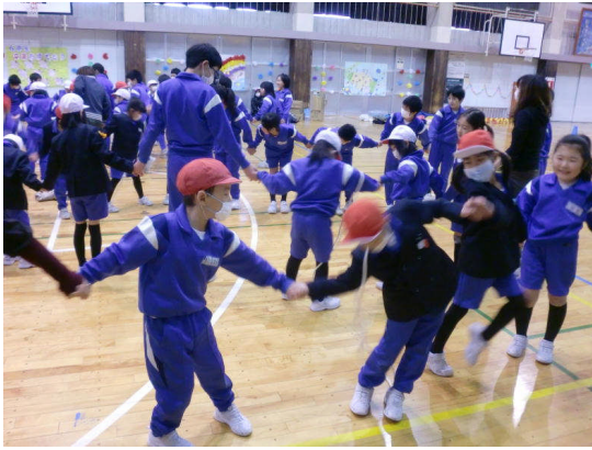
みんなでくねくねわくぐりレース