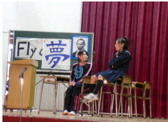
夢を大切に そして、夢を実現したい!