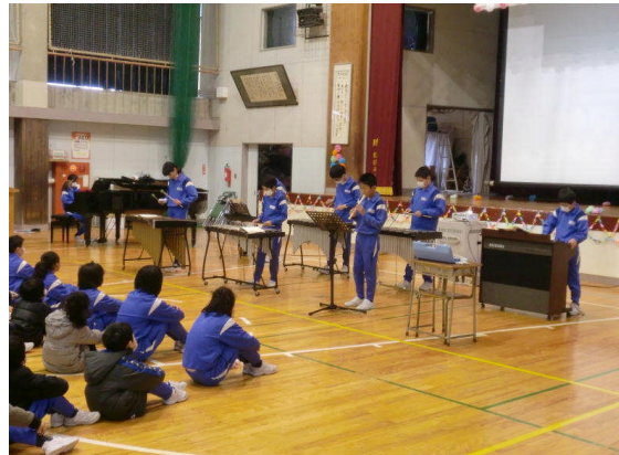
6年生合奏(ラバースコンチェルト)

オープニングは、5年生が振り付けを考えた元気な踊りで始まりました。5年生11人が音楽にのりながら、ピッタリ息を合わせて、頑張りました。その後に、幼稚園児から5年生が考えたゲームやクイズを6年生と一緒にしながら、温かい雰囲気の中で、互いにふれ合いを楽しみました。6年生からは、美しい音色の合奏の披露があり、楽しいひと時を過ごすことができました。また、小学校での思い出や将来の夢を映像をまじえながら6年生から紹介があり、感謝の気持ちを込めてみんなで大きな拍手をおくりました。