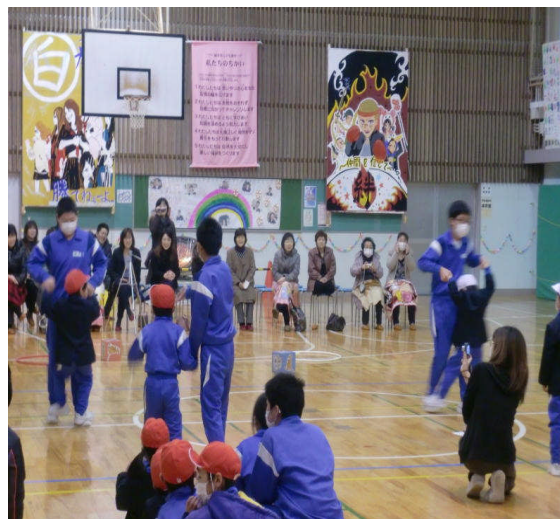
ペンギン・コアラ・カンガルー