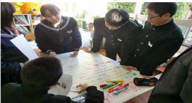
グループで資料を作ろう