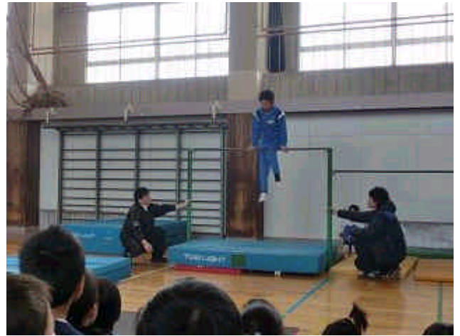
難しい技に挑戦!(鉄棒)