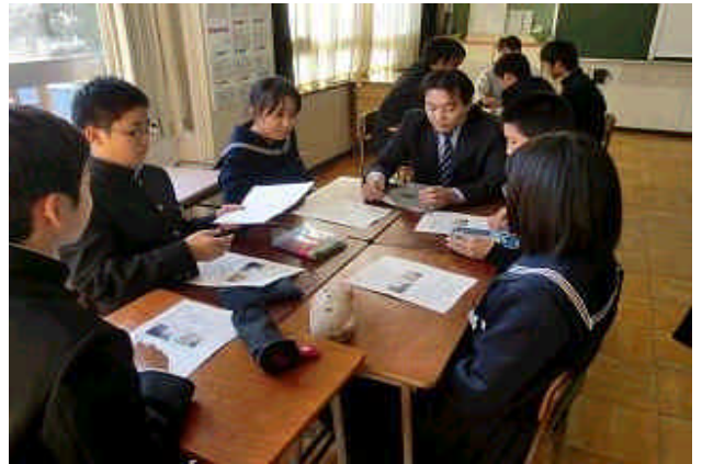
社会のため、人のために役立ちたい