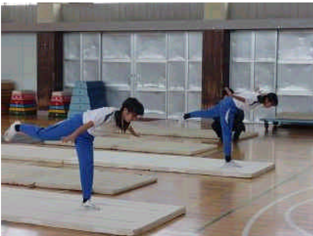
体の線を美しく(マット運動)