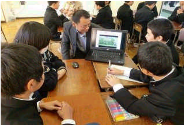
信頼される仕事が大切!