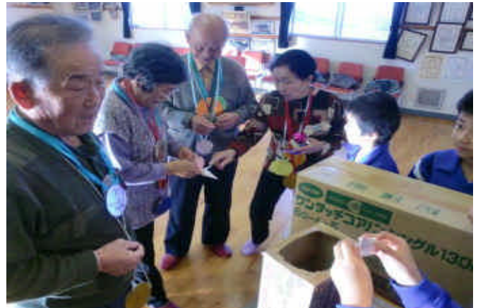
くじ引き(大当たりが出ますように)