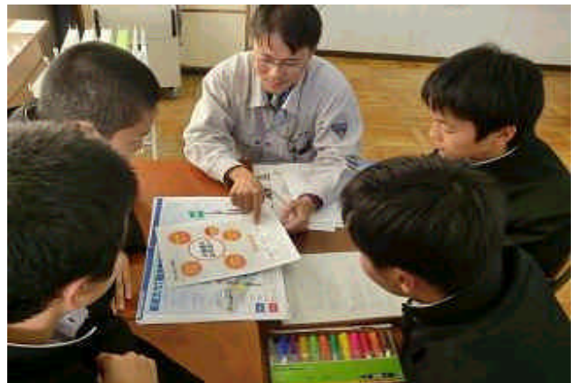
技術と経験を結集して素晴らしいものを