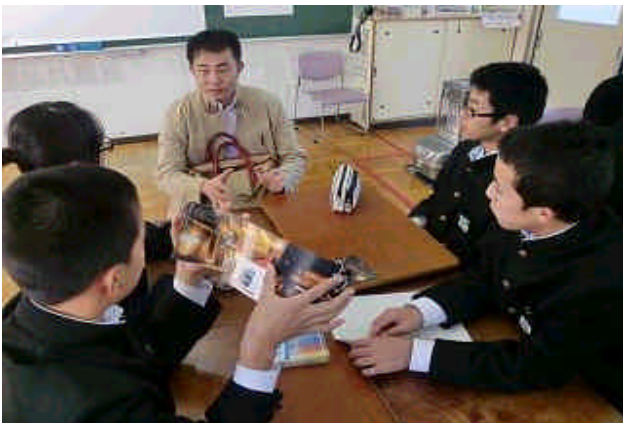
人に喜ばれる料理をつくるために