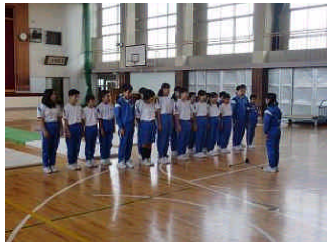
4年生からの激励の言葉

体育の時間や放課後に器械運動の練習を一生懸命に頑張りました。今日は、保護者の皆さんや幼稚園児から小学4年生を前に、演技を披露しました。どの選手にも会場から、いっぱい拍手をいただきました。明日26日には、越廼小学校で、鷹巣、長橋、国見、越廼、殿下の各小学校が集まって、器械運動交歓会が開かれます。一つ一つの技に集中して、一杯頑張ってください。