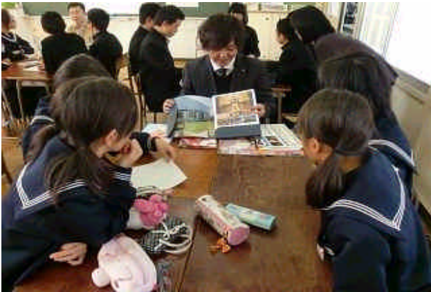
最高のブライダルをプロデュースする