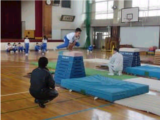
跳べ！高く遠くに(跳び箱)