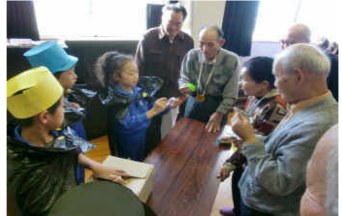
不思議なマジックショー

3年生と4年生が、地区のおじいちゃん、おばあちゃんを公民館にお招きして、ふれ合い交流会を開きました。まとうれやくじ引き・手品など4つのコーナーに分かれて、楽しんでもらいました。プレゼントは、子どもたちが画用紙で作ったメダルや折り紙です。どの子ども、コーナーで自分の役割をしっかりと頑張りました。おじいちゃん、おばあちゃんのすてきな笑顔をいっぱいもらった子どもたちは、満足感いっぱいの顔をしていました。