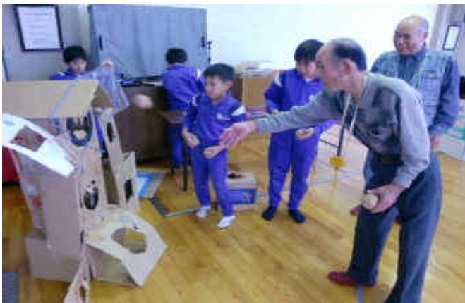
ボールのまとうれ(うまく入るかな)

平成22年12月14日(火) ふれ合い交流会(小学3・4年生) 「おじいちゃん、おばあちゃんの笑顔が見れて良かった」