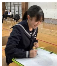
上手にかけたかな？