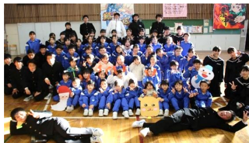
小中学生、全員集合！