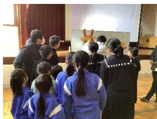
みぎ、みぎ！ すこしひだり！