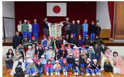
大きな布が織れました!