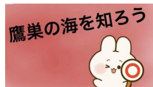
<鷹巣の海を守ろう>