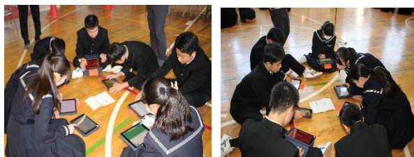
<縦割りグループによる話し合いの様子>

また、1～3年の縦割りグループで、自分たちの鷹巣中学校をよりよくするための話し合い活動を行いました。各グループで、タブレットを活用し、活発な意見交換をすることができました。「鷹巣中の良さ」や「改善したいところ」など、学校について、みんなで考えることができた有意義な時間になりました。