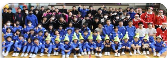
小中全校生徒で記念写真！