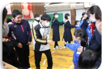
小学1～3年生とのじゃんけん列車はとても盛り上がりました。

12/15(金)に執行部主催によるクリスマス集会が行われました。今年度は2部構成になっており、5時間目が中学生と小学1～3年生が、6時間目は中学生と小学4～6年生が交流を深めました。。