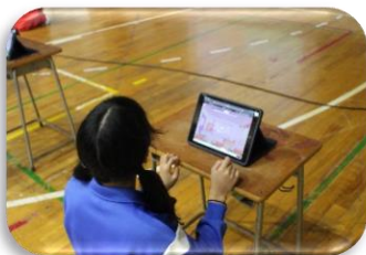
タブレットを使った3択クイズは難問だらけでした。