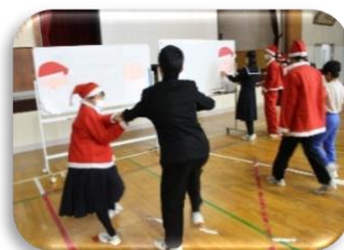
小学4～6年生のサンタ福笑いは楽しいサンタがたくさん！