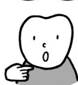
歯と歯ぐきのさかいめ