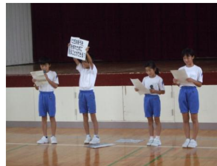
【目にかんする〇×クイズ】

この機会に、目の体操と給食後遠くを見る時間を作るなど、目のリフレッシュタイムをとっていきましょうね。