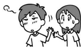
呼びかけに対して返事がおかしい