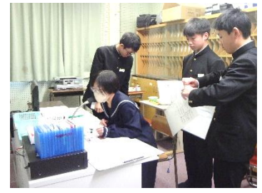
【各委員長のサポート】