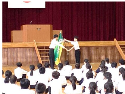
【生徒会旗引き継ぎ】