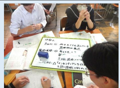
ひとりの筆者の文章を観点から評価しています。