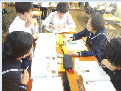
疑問点を深める為、一人一人が違う観点から考えます。