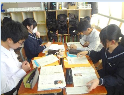
これって現実的なのかな？違うよね～。

3名の説明的文章を比較し、それぞれの文章に対し、納得度を評価する授業です。文章を読む観点を示し、生徒が批判的に読めることや評価できる工夫がありました。同じ筆者の評価に◎○△が出され、その理由を深掘りする次時が楽しみです。