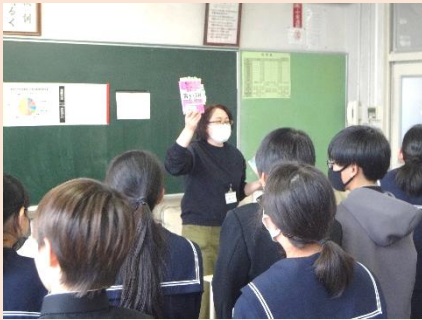
興味がある本を手にとって、読んでみてください！

読書の秋。市の選書会の本を直接手に取って読み、本校の図書室に入れたい本を選んでいきます。学校司書より、①みんなが読む本（公共性）②必要な本 ③新たな発見や気づきにつながる本を基準にして、その本を選んだ理由を記入する説明がありました。