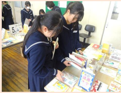
迷うなあ。これも、おもしろそうだなあ。