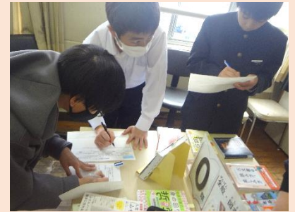
この本は0類だから、分類番号は「0」だよな。