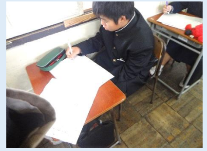
3名のレポートからベスト1を選び、理由を記入中！