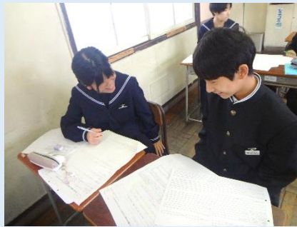
友だちの質問に対して、わかりやすく説明中！