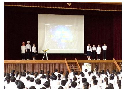
【生徒会スローガン発表】

認証式後、全校生徒に向けて、執行部が発表した2学期の生徒会スローガンは、「SHIN 星団～見えてない輝きを 観測しよう～」でした。このスローガンは、生徒会の活動が「見える」という視点を軸に執行部が構想を描きました。SHINには、進明の「しん」、新たに進んでいく「しん」、様々な生徒会活動が浸透していく「しん」の意味が込められています。星団には、執行部、代常学、挨拶コンタクト拶、ほっこリアクションなど、伝統として引き継がれているひとつひとつの活動を意味しています。