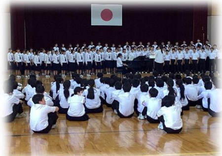
【 校内発表会 】

前日の事前発表会でも、最高学年として、素晴らしい歌声を披露しました。3年生は、1年生と2年生にとって、まさに憧れの存在と言えます。