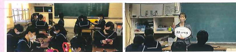
地域講師を招いて