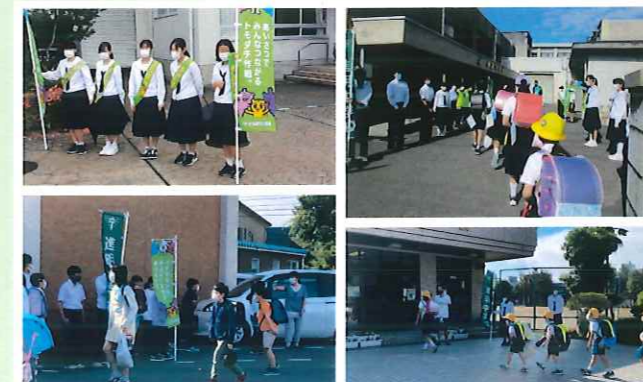
小中学校あいさつ運動