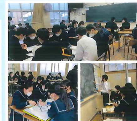
自ら学ぶ力向上タイム