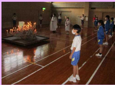
キャンドルがきれいです