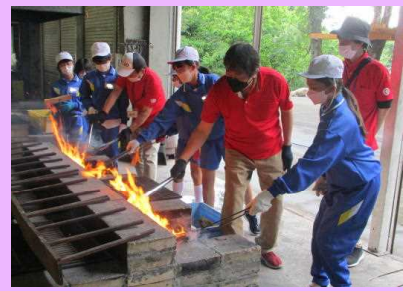
火を使ったダイナミックな活動