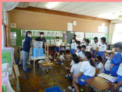
「5年出前授業」 用水のはたらき