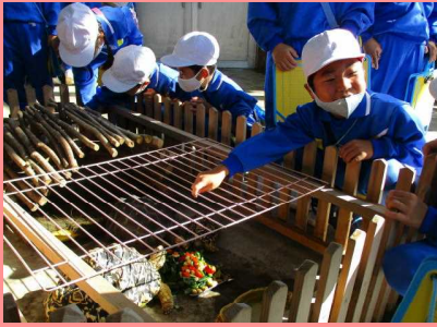
「1年校外学習」 足羽山探検