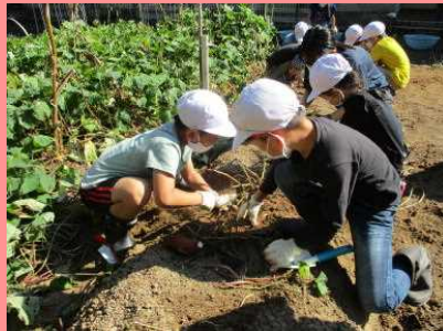
「2年生活科」 サツマイモの収穫