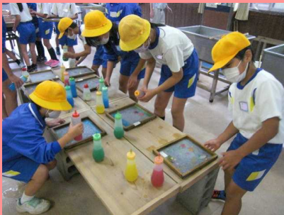
「4年社会科見学」 紙すき体験