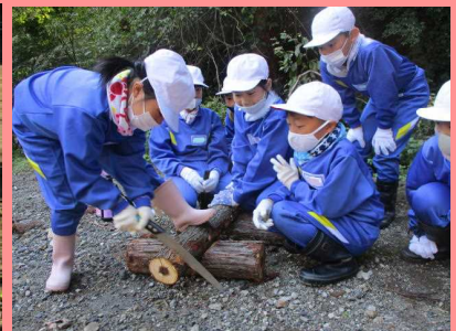
「3年総合」 どんぐり教室②