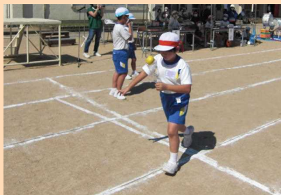
「4年」 ペットボトルでミニ聖火リレー