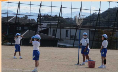
「1年」 ダンシング玉入れ