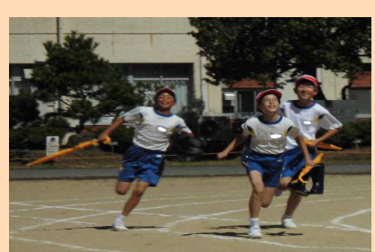
「6年」 めざまし天気予報