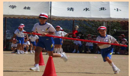
「3年」 北っ子タイフーン