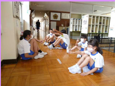
「縦割清掃」6年生がリーダーとしてがんばっています