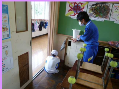
上手に雑巾絞れるかな…