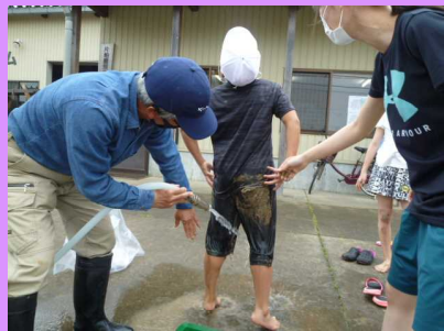
泥だらけになっても気持ちいい…