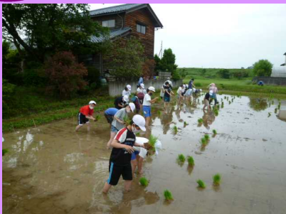
「5年田植え」今年の5年生は今まで一番上手とほめられました