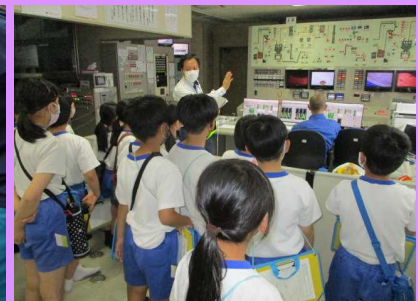
「4年社会科見学」クリーンセンターに行きました