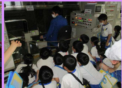
大きな機械の操作も見ることができました