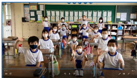
メッセージを伝えている場面

交流に向けて、まず4年生は自己紹介ビデオをつくりました。また、国語の学習を生かして清水東小学校全学年にアンケートをとり、清水東小学校の児童について伝えることにしました。一つずつ作業を進めながら、交流を成功させようと頑張っています。