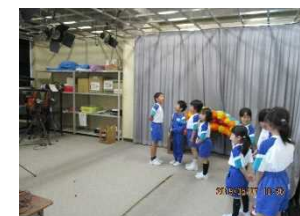
豊かな心の育成（1,2年合同校外学習「西山公園」 1,2年合同学習「学校探検」 フレンド集会「ようこそ1年生」・「よろしく縦割り班のみんな」