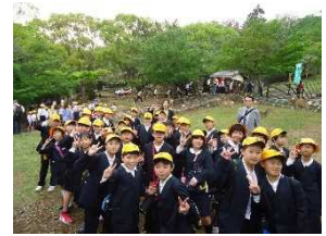
学ぶ力の育成（6年修学旅行「大阪・奈良・京都」 4年校外学習「防災センター・消防署」 3年校外学習「学校の周りの様子」