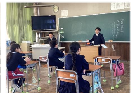
4/10 委員会活動がスタート