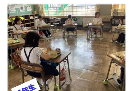
1年生 4/15 給食開始