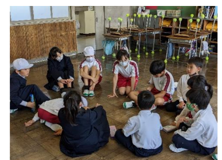
4/19 縦割り班活動 顔合わせ