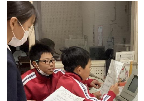
4/18 委員会の仕事がスタート