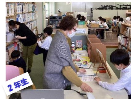
4/19 図書館の使い方の学習