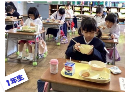
4/17 1年生初めての給食