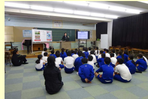
【6年生 薬物乱用教室】