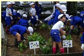
【1年・2年生 いもほり】