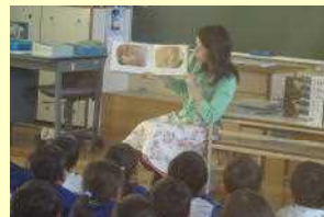
【1年から4年生 読み聞かせ】