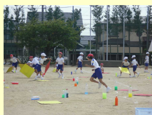
【ミッションインポッブル2】