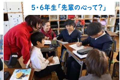
5・6年生「先輩の心って？」