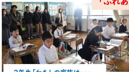
2年生「わたしの家族は・・・」