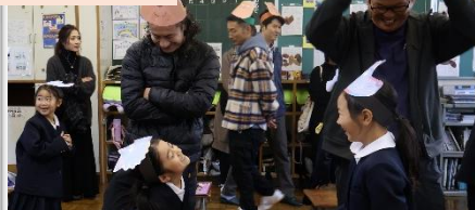
1年生「やさしくできる自分をみつけよう！」