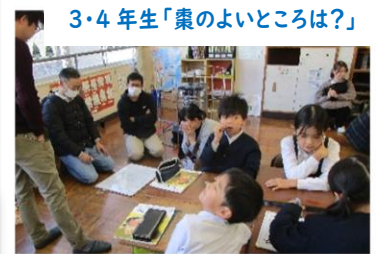
3・4年生「桌のよいところは？」