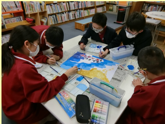
みんなで共同作業中

「福井の海を守る会」からの依頼を受けて、5・6年生が「海を大切にしよう!」をコンセプトにした看板の下絵（ポスター）を描きました。5・6年生全員が絵や文字などで関わり、一つの絵を仕上げました。出来上がった看板は、 銚島駐車場 に設置されるということで、除幕式が3月3日（水）に予定されています。自分たちの描いたポスターがどんな仕上がりになるか、とても楽しみです。お近くにお寄りの際は、ぜひご覧いただきたいと思います。