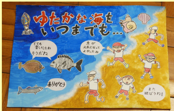
この絵が看板になります。楽しみ〜!