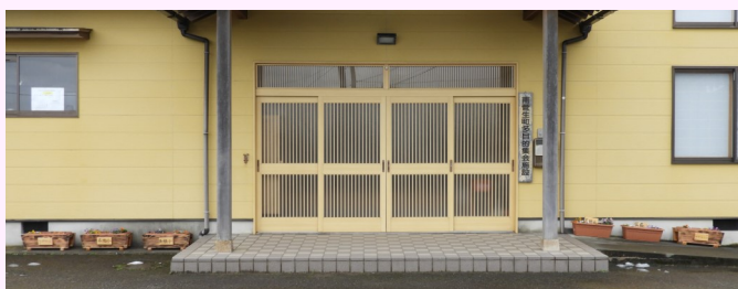
南菅生地区は、集落センター前に。