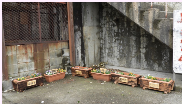
長橋地区は、ゴミステーションの横に。