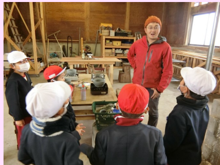
志野さんから説明を聞きました。