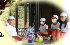
お弁当、おいしかったね。