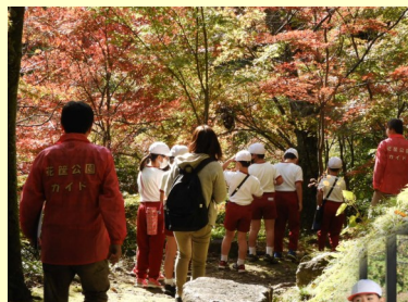
花筐公園の紅葉がきれいでした。