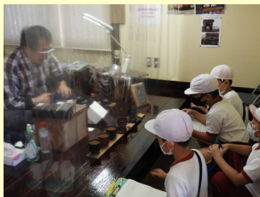
職人さんの作業の様子や漆器製品の見学をしてきました。

社会の学習の一環で、福井の伝統工芸である「越前漆器」と「越前和紙」について学習をしてきました。私(校長)も一緒に参加させてもらったのですが、どの見学場所でも丁寧に説明をいただき、とても勉強になった1日でした。3・4年生の『見学のまとめ』がとても楽しみです。