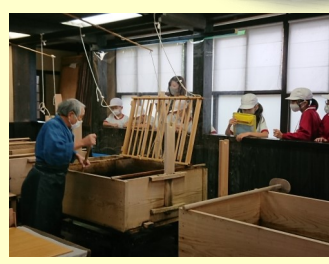
はがき作りをしてきました。職人さんが和紙を漉く様子も見せてもらいました。