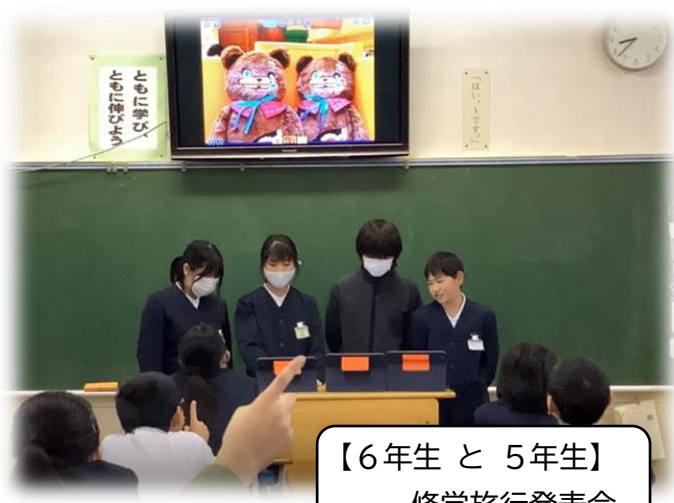
【6年生と5年生】 修学旅行発表会