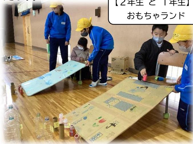
【2年生と1年生】 おもちゃランド

また、ペア学年（1年生と6年生、2年生と4年生、3年生と5年生）を組み、上級生が下級生に楽しんでもらえるよう遊びの企画をし、一緒に楽しむ活動をしています。これらの活動をすることにより、上級生は下級生の手本となれるよう意識したり、下級生は上級生の良い姿を見て学んだりすることが期待できます。