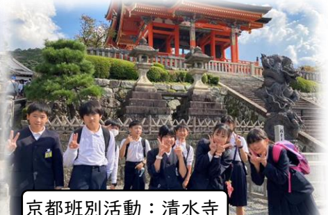
京都班別活動：清水寺