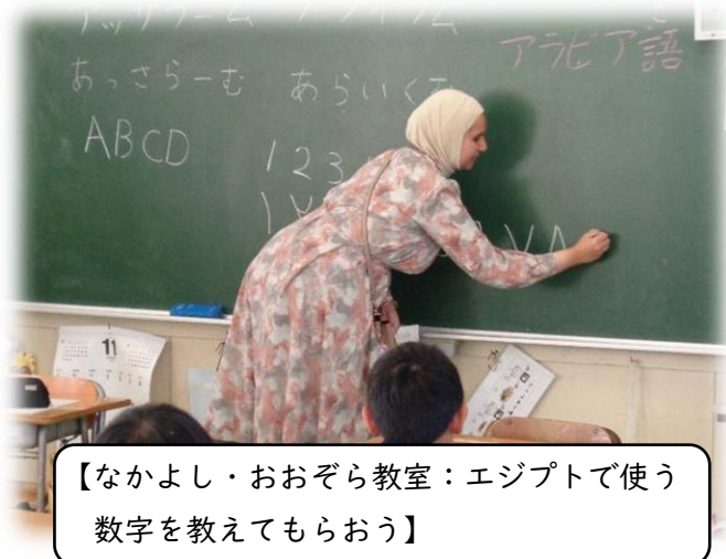
【なかよし・おおぞら教室：エジプトで使う数字を教えてもらおう】

2限目と3限目には、各学年の授業を参観されました。参観を受けたクラスでは、エジプトのことを学んだり、エジプトの方々と交流したりできるような授業を準備し、互いに交流していました。