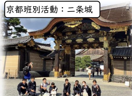
京都班別活動：二条城