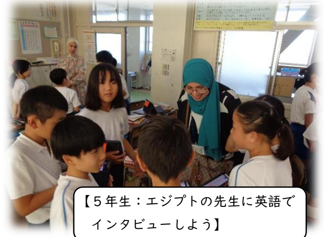
【5年生：エジプトの先生に英語でインタビューしよう】

来校されたエジプト人の教員や同行した福井大学教職員大学職員から、森田小学校の子どもたちの学習に取り組む様子・態度や本校の教育活動について、高い評価をいただきました。