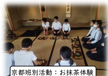
京都班別活動：お抹茶体験

社会の歴史学習で学んだことを自分の目で再確認をしたり、友達との時間を大切にしたりと、多くのことを学べた修学旅行となりました。学んだことをまとめ、5年生に発表する予定です。