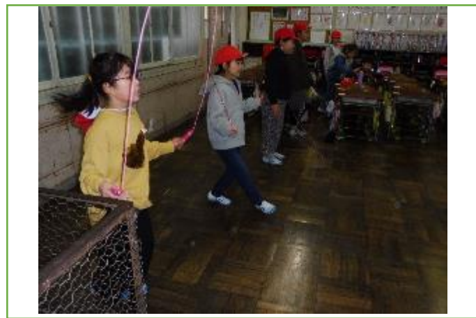
4分間跳び続けること目指してがんばるぞ！