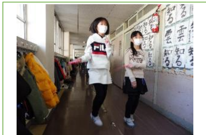
2人で息を合わせて跳ぶと楽しいよ。