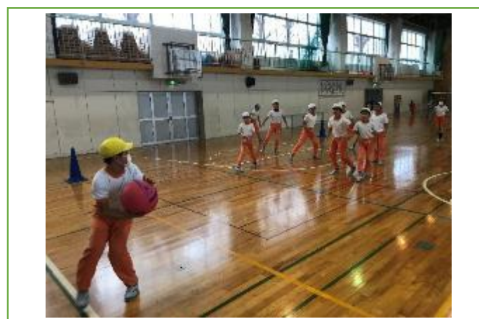
高学年とドッジボール対決 ドキドキ！