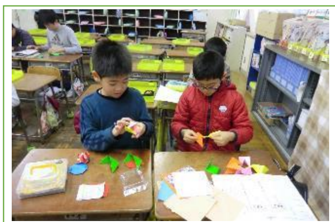
折り紙で細かいところまで丁寧に作ったよ。