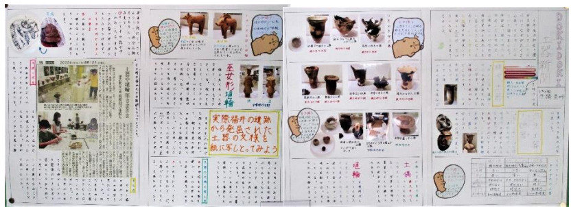
6年生 DOKIDOKI 土器新聞