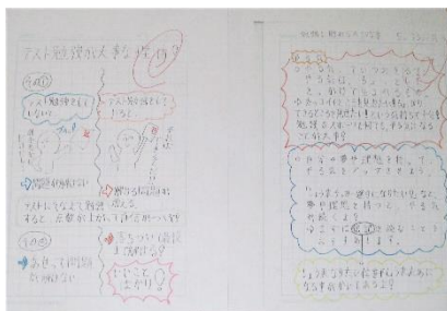
6年生 テスト勉強が大事な理由