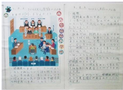
5年生 さいばんしょ見学に行ったよ

家庭で行う自主学習を学期中には推奨しています。読書や自学ノートなど、家庭で自主学習を工夫して取り組めるように声を掛けています。子どもたちは、授業の復習や漢字・計算を繰り返し練習するドリル学習(ばっちりメニュー)、自分の興味のあることを調べたり考えたことをまとめたりする学習(わくわくメニュー)に取り組んでいます。おもしろい着眼点で取り組んでいる子やまとめ方に工夫の見られる子の自学ノートを教師が紹介したり、互いの自学ノートを見せ合ったりすることで、互いによいところを学び合えるようにし、自主学習に取り組む意欲を高められるようにしています。