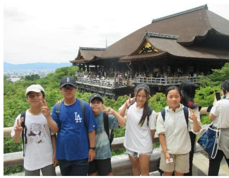
清水の舞台で京都市内をながめながら