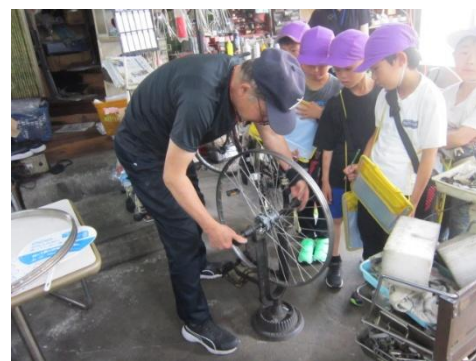
スガハサイクルでタイヤの説明を聞く