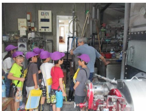
銭湯松葉湯の裏側に興味津々

6月9日(火)、2年生が生活科「自分の住んでいる地区を知ろう」で校外学習へ出かけました。学級を解いて混合チーム編成の下、地区の中で予め調べたい店舗や施設の中から2ヶ所を選び、徒歩で移動しました。子ども達は張り切ってそれぞれの店や店舗に向かい、元気な挨拶の後、しっかりと話を聞き、知りたいことを教えていただきました。今回の校外学習では、12ヶ所の店舗・施設のご協力と共に保護者ボランティア21名の同行を得ることで、交通安全と熱中症対策も万全に活動を終わることができました。貴重な時間を学習活動の支援に充てていただいた地域の店舗、施設、そして保護者の方々にこの場を借りてお礼感謝申し上げます。ありがとうございました。