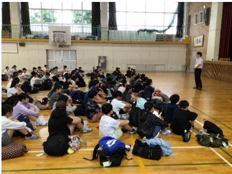
全員集いよいよ出発！

6月4日(木)5日(金)、6年生は「常に上を目指す・何にでも全力・みんなで助け合う」ことを目標に京都・奈良・大阪での修学旅行に出かけました。京都・奈良では世界遺産を中心とした歴史的建造物を見学し、ガイドさんやタクシーの運転手さんからくわしい説明を聞き、実物を見学することで、日本の歴史と伝統について直接学ぶことができました。ホテルでは、大阪城を眺めながらの夕食や部屋での友達との交流など楽しい時間を過ごすことができました。最後のUSJではアトラクションを思い切り楽しみ、全員時間に間に合うように集合することができました。学年全体で満足度の高い修学旅行となりました。