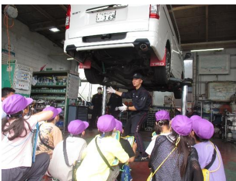
福井トヨタで車の修理について