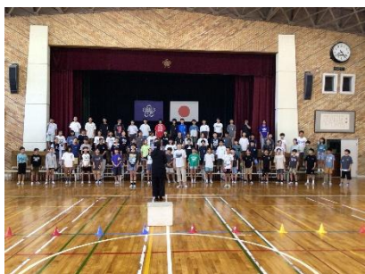
素晴らしい歌声が響いた校内発表

6月23日(火)、第65回福井市連合音楽会がフェニックスプラザエルピス大ホールで行われました。みんなが感動する連音に！やってみよう！と、一人一人が全力で上を目指して取り組んだ成果を発表しました。保護者の皆さまには、事前に校内発表でその歌声を鑑賞していただき、ありがとうございました。