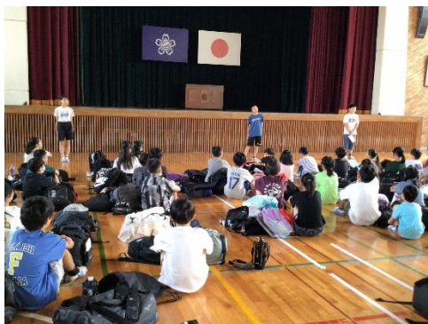
出発式で気持ちを引き締める

6月16日(火)17日(水)、5年生があわら青年の家での宿泊学習に出かけました。1日目は入所式後、野外でのカヌー体験とディスクゴルフ体験を行いました。カヌーでは、うまく前に進まず苦戦しながらも、パドルの操作を少しずつ身につけることができました。夜は、キャンドルサービスで楽しいひとときを過ごし、絆を深めました。2日目は、野外でモルック体験を行い、その後、飯ごう炊さんでカレーライスを作りました。安全面に配慮して保護者ボランティア9名の方にも加わっていただき、火起こしや調理に苦労しながらも、最後はおいしいカレーを完成させました。1泊2日で深めた友情をこれからの学校生活に活かし、学年の力を高めていってほしいものです。ご協力いただいた保護者ボランティアの方々にこの場を借りてお礼申し上げます。ありがとうございました。