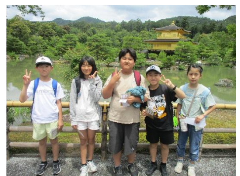
鹿苑寺(金閣寺)の美しさに感動