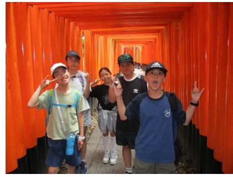
伏見稲荷の千本鳥居をくぐり抜けて