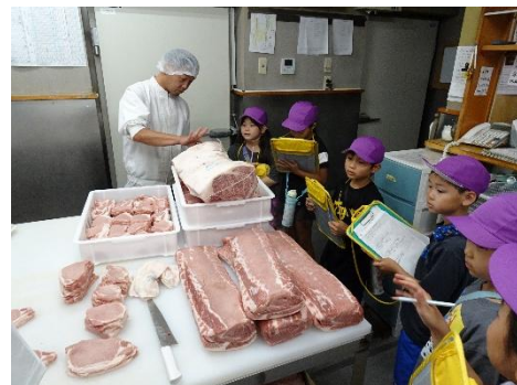
肉のはまやで大きな肉の塊にびっくり