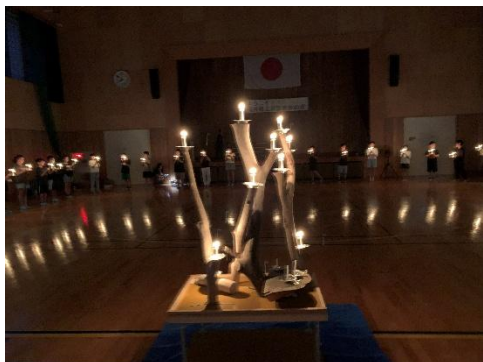
思い出の夜となったキャンドルサービス