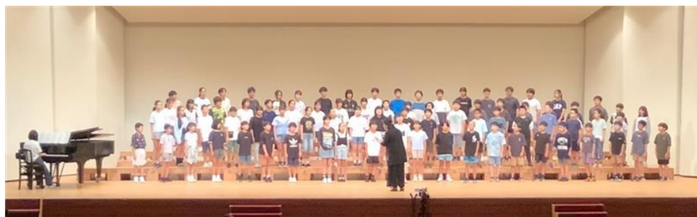
学年83名、一人一人が輝いた本番のステージ