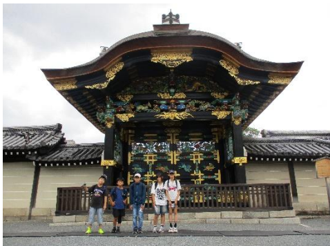
南禅寺の美しい門にて