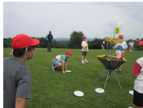
芝生広場でディスクゴルフ体験