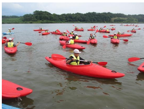
やがては自分で自由に行きたい方向へ