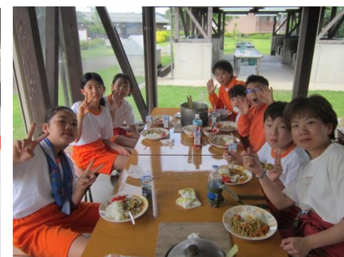
おいしいカレーに大満足