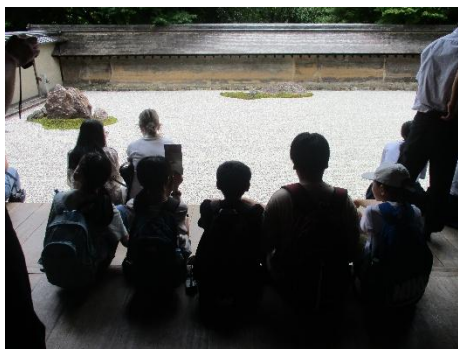
龍安寺にてわびさびを感じる