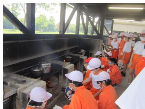
初めての火起こしに挑戦