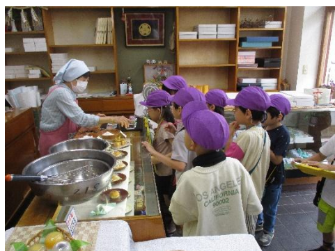
おいしそうな和菓子が並ぶ梅家菓子