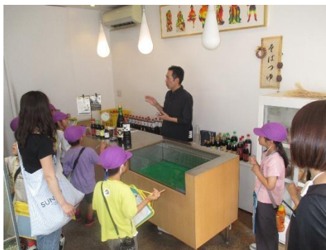
古村醤油で醤油の種類や原材料を尋ねる