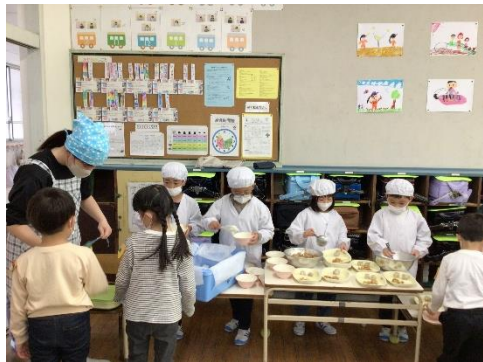
給食当番さん上手に分けています

24日からは、2年～6年の子どもたちと一緒に掃除を始めました。ぞうきんをしぼるのを手伝ってもらったり、ぞうきがけをする場所を教えてもらったり、豊小の一員としてどんどんレベルアップしています。