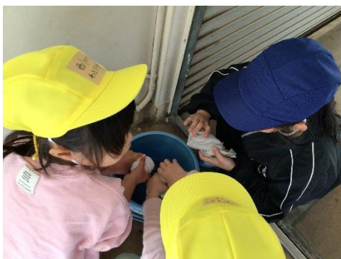
ぞうきんはしっかりしぼるよ