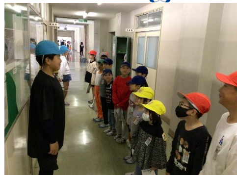
整列してあいさつするよ