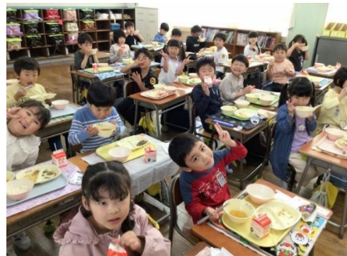
みんなで食べるとおいしいね