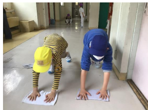
ぞうきがけのやり方を教えるよ