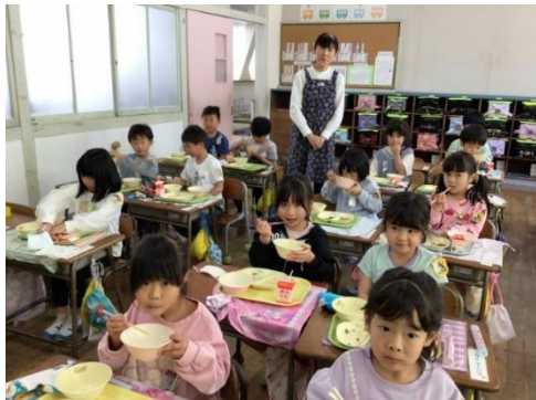
がんばって残さず食べるよ