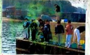
これは魚つりです。