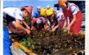
これはわが家の干しです。