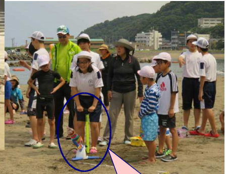
ペットボトルロケット飛行距離競争